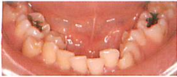
小臼歯非抜歯矯正の治療前