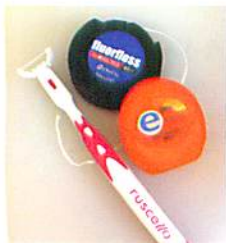
(歯ブラシ・フロス写真)

当院では、患者さんごとに最適な歯ブラシやフロスを選択して、お使い頂いています。歯やお口の状態は十人十色。みんな同じケアではありません。皆さまも、GMDCで正しく効率的なデンタルケアを体験して下さい!