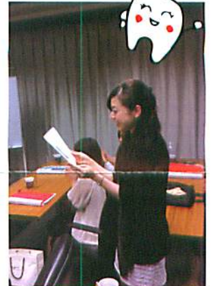
修了証を頂いて、嬉しい\(^o^)/