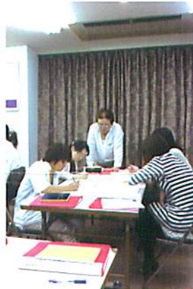
もちろん頑張って研修を受けてきました(^^)