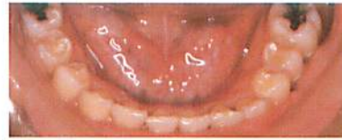
小臼歯非抜歯矯正の治療後