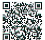
銀座みゆきスタッフブログ QRコード

「歯」は、“止”と“口”の二つから出来ていて、「物をかみ止める前歯」「口の中に並んではえている」という意味なのです。昔の人ってすごいですね(^^) (スタッフブログです、みてね http://ameblo.jp/123gmdc/ )