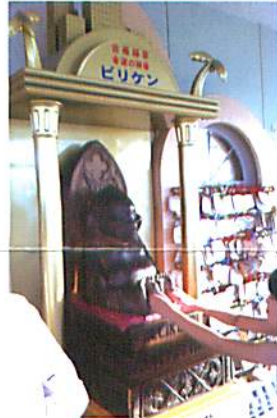
ピリケンさんもいましたよ!