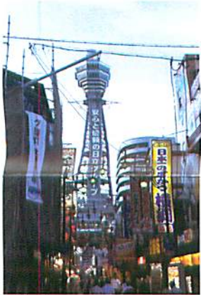
研修の合間に通天閣に行きました!

6月に大阪ホリスティックデンティストリー「歯科における栄養指導」の研修をスタッフ全員で受講してきました。